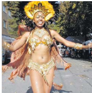
Gelebte Integration. Bunters Programm erwartet wieder die Besucher.

(mum). Am 11. September findet zwischen 12 Uhr und 22 Uhr wieder das Fest der Kulturen zwischen Ennsgasse und Max-Winter-Platz statt. Besonderes Highlight wird das Konzert von Jazzgitti am Vorgartenmarkt sein. Für Groß und Klein wird von Kinder-Animation über Tanz und Kultur bis hin zu kulinarischen Schmankerln ein buntes Programm geboten. Infos: www.einkaufsstrassen.at